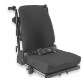
Rücken: ATC 2174, 2175