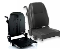
Rücken: ATC 2172 bzw. 2173