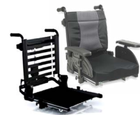
Rücken: ATC 2171